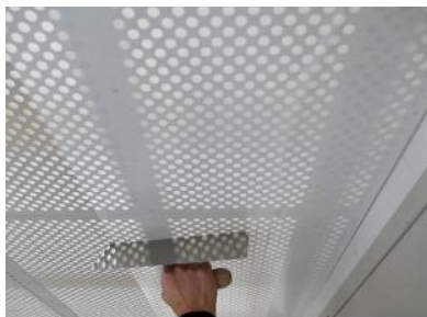
Anbringung der Dots, festdrücken mit Glättkelle

Empfehlenswert ist die Fläche mit den Klebspunkten zu erwärmen, somit lösen sich die Dots besser von der Trägerfolie. Die Cleaneo SYSTEXX Dots müssen vollflächig aufgebracht sein.