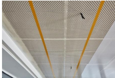
Stegbereiche abgedeckt, jeder 2. Steg muss belegt werden.