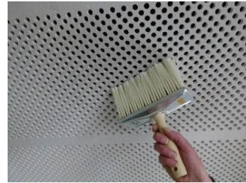
Grundierung Cleaneo SYSTEXX Acoustic Board

Die fertig erstellte Konstruktion beplankt mit Lochplatten muss zwingend notwendig mit einem wässrigen Tiefengrund grundiert werden. Dieser muss mit einer Bürste aufgetragen werden (keine Rolle!)