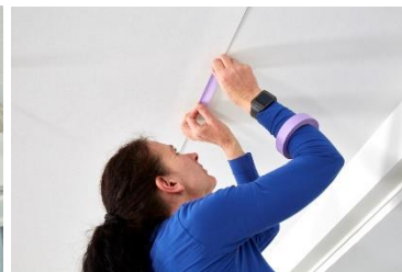
Cleaneo SYSTEXX Silent Überlappungsbereich

Bitte verarbeiten Sie das Material nicht mit herkömmlichen Tapezierwerkzeug! Die Gefahr der Oberflächenbeschädigung ist sehr hoch.