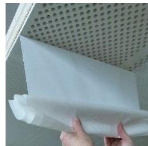
Trägerfolie im 90 Grad Winkel abziehen.