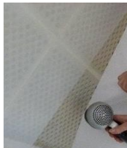
Erwärmen mit dem Fön