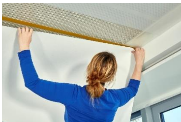
Cleaneo SYSTEXX Silent ansetzen am Silikonband

Zum Anbringen der Tapete wird eine weiche Tapezierbürste oder ein weicher Roller verwendet. Hiermit werden die Bahnen mit gleichmäßigem Anpressdruck angedrückt. Die Bahnen werden am Cleaneo SYSTEXX Tape ausgerichtet. Hier ist besonders wichtig, die ersten Meter exakt am Rande des Tapes anzulegen. Wir empfehlen ein Arbeiten im Zweierteam.