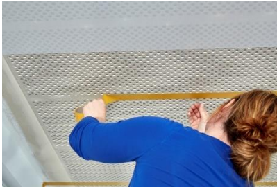
Anbringung des Silikonbandes

Die Stegbereiche, in denen ein Doppelnahtschnitt ausgeführt wird – müssen vor dem Tapezieren mit Cleaneo SYSTEXX Tape (Silikonband) abgedeckt werden. Die Bahnenbreite der Cleaneo SYSTEXX Silent beträgt 83,8cm, somit wird an jedem 2. Steg ein Tape benötigt. Muss ein Schnitt in Querrichtung ausgeführt werden z.B. beim Bahnende, muss dieser ebenfalls an einem Steg ausgeführt werden, der vorher mit einem Cleaneo SYSTEXX Tape belegt wurde.